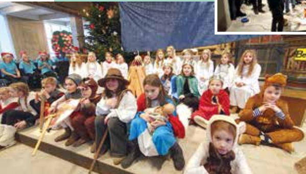
Krippenspiel in Horneburg