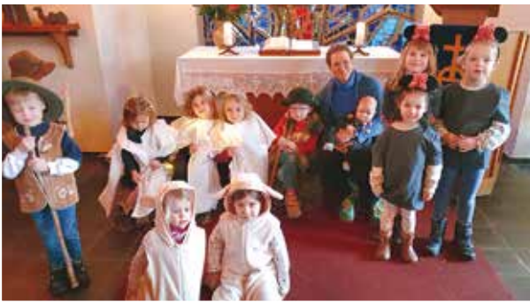
Krippenspiel der Grashüpfer in Nottensdorf