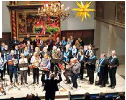
Die Hornelujas mit dem Posaunenchor