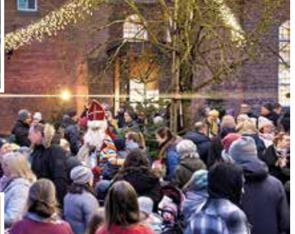
Der Nikolaus zu Besuch auf dem Weihnachtsmarkt